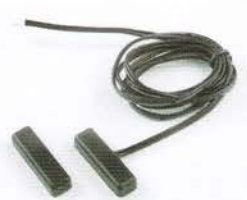
開閉連動スイッチ