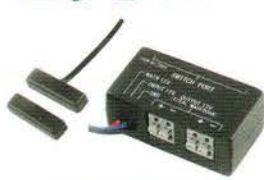
・フットライト統合ユニット ・開閉連動スイッチ